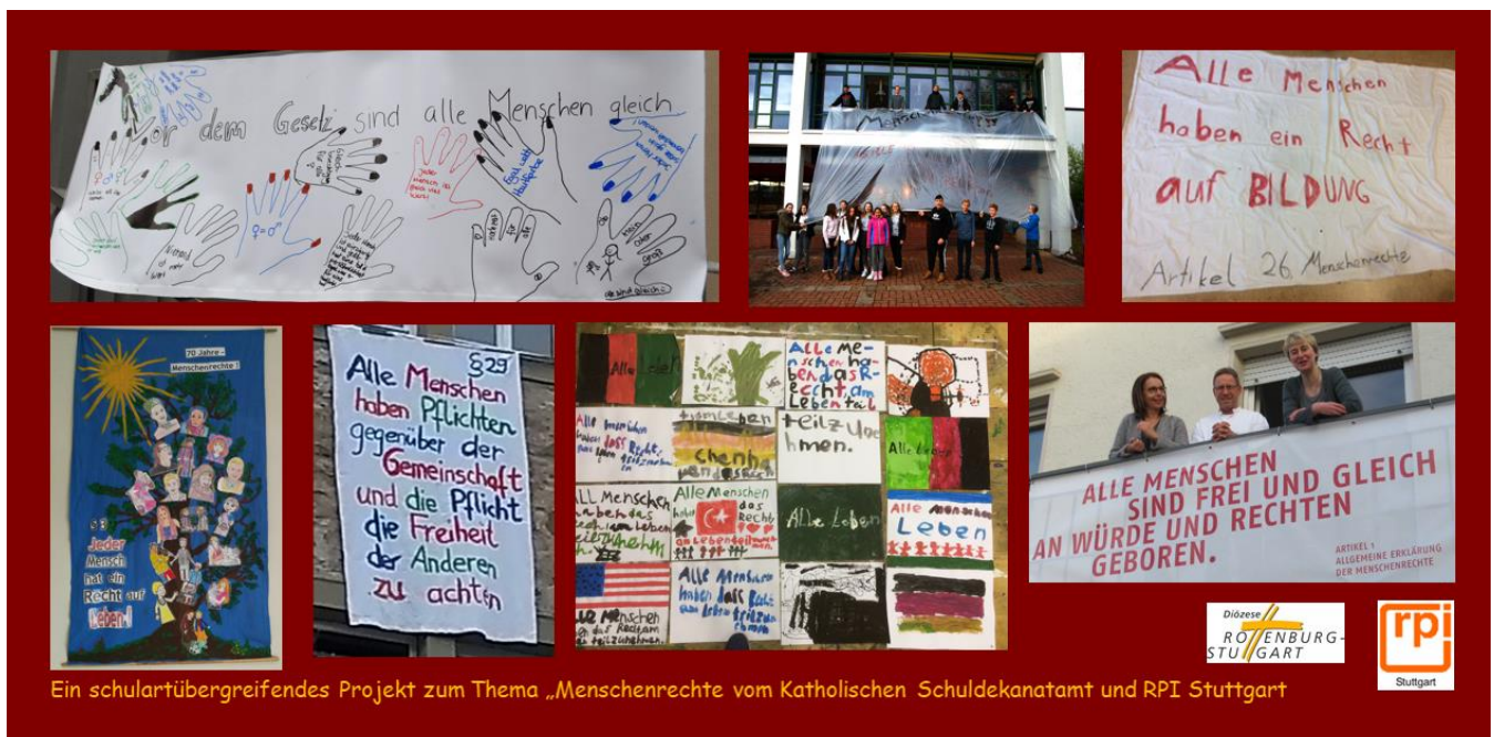
Ein schulartübergreifendes Projekt zum Thema „Menschenrechte vom Katholischen Schuldekanatamt und RPI Stuttgart“